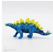
ステゴサウルス フィギュアイメージ