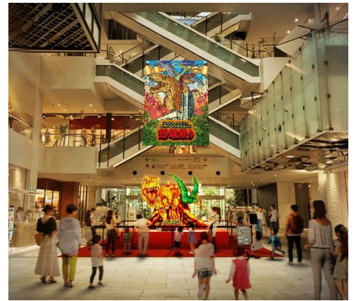
恐竜ねぶた イメージ