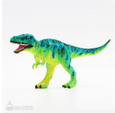
ティラノサウルス フィギュアイメージ