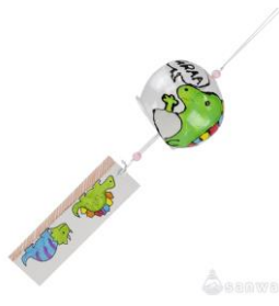
オリジナル恐竜風鈴イメージ②

夏の風物詩の風鈴に、各施設に展示された恐竜を思い起こしながら、オリジナルの恐竜の絵を描けます。