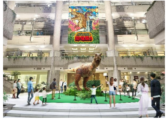
ティラノサウルス展示 イメージ