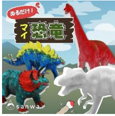
恐竜フィギュア イメージ①

4種類の恐竜(ティラノサウルス・トリケラトプス・ステゴサウルス・ブラキオサウルス)の中から一つを選び、色を塗って、自分だけのオリジナルカラーの恐竜フィギュアを作ることができます。想像力をふくらませて、世界に一つだけの恐竜を作れます。