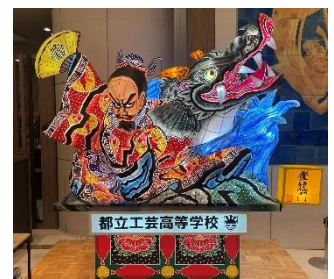
東京ドームホテル展示 2024年出展ねぶた