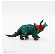
トリケラトプス フィギュアイメージ