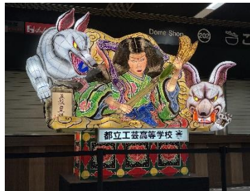
ふるさと祭り東京・新宿住友ビル展示 2023年出展ねぶた

今回のイベントのねぶた制作を担う「東京都立工芸高等学校(定時制課程)ねぶた造形研究部」は、毎年1台のねぶた制作をメインに活動しているほか、ねぶた技法を生かした造形の制作や各種イベントへの参加、協力を行っています。イベント期間中、MARK IS みなとみらい館内には、2023年と2024年に制作したねぶたを展示します。ぜひ迫力のねぶたをご覧ください。