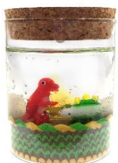
恐竜キャンドル イメージ①