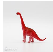
ブラキオサウルス フィギュアイメージ