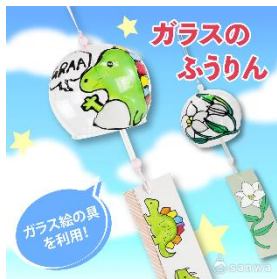
オリジナル恐竜風鈴イメージ①