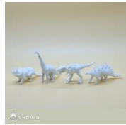
恐竜フィギュア イメージ②