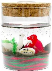
恐竜キャンドル イメージ②

その他のワークショップも予定しています。詳細は決定次第、公式ホームページにてご紹介いたします。